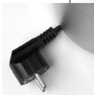
Opbevaringsrum til strømkabel i bunden