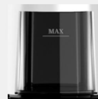
Opsamlingsbeholder med maksimalt påfyldningsmærke