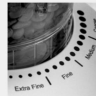
Indstilling for malefinhed

Hvis espresso eller kaffe tager for lang tid at brygge, så prøv en grovere malingsindstilling.